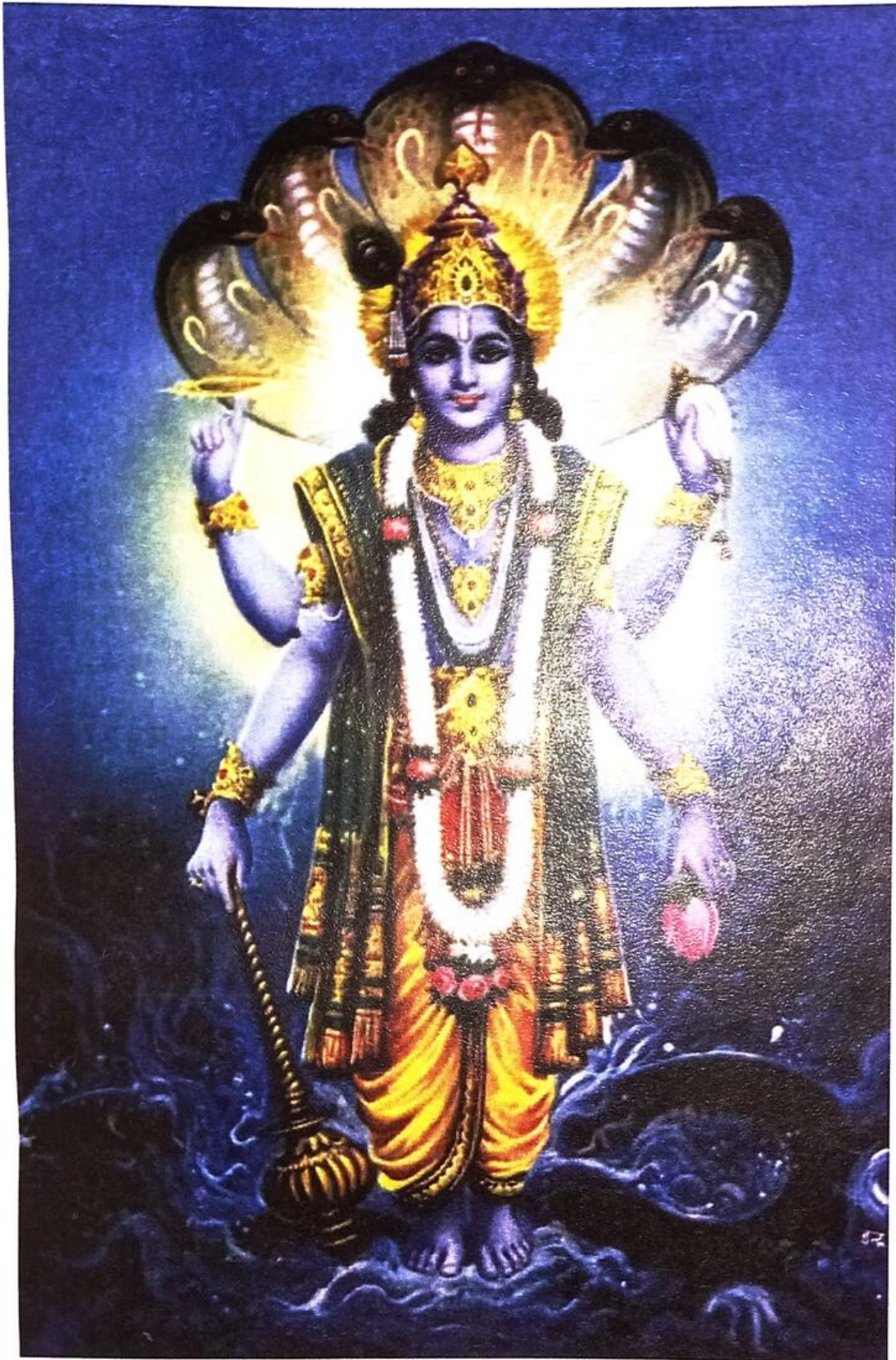
Anantadeva (Tamasi) O Senhor da Escuridão Primordial personificada Também conhecido como Krsna (O Negro)