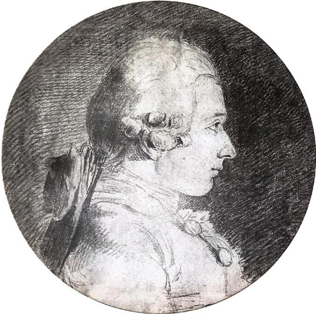
Marquês de Sade 1740 - 1814